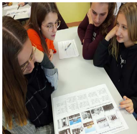
Rencontre entre les élèves des 2 classes

C'était émouvant de revoir les anciens élèves d'Euro allemand de notre collège et de voir leur évolution. C'était intéressant et sympathique d'apprendre de façon ludique, on retient ainsi.